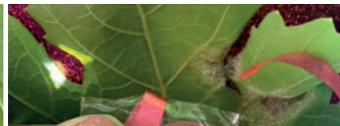
MIMOTEN® (3 días después de la aplicación)

MIMOTEN® logra controlar el avance de la infección fúngica de mildiu en vid, reseccándolo en 48-72 horas.