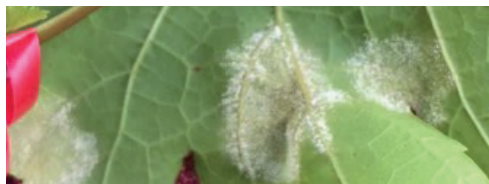
CONTROL (antes de la aplicación)